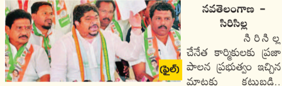
నవతెలంగాణ - సిరిసిల్ల

నేతనల్ల కార్మికులకు ప్రజా పాలన ప్రభుత్వం ఇచ్చిన మాటకు కట్టుబడి... స్వయం సహాయక సంఘాలకు అందించే యూనిఫాం చీరల ఆర్డర్ ఇచ్చి పెద్దఎత్తున పని కల్పించిన రవాణా శాఖ మంత్రి పొన్నం ప్రభాకర్ మంగళవారం ఒక ప్రకటనలో పేర్కొన్నారు. స్వయం సహాయక సంఘాలకు అందించే ఇందిరా మహిళా శక్తి పథకంలో భాగంగా అందరికీ ఒక రంగు గల ఒక్కొక్కరికీ ఒక్కో చీరను అందజేసేందుకు 4.24 కోట్ల మీటర్ల చీరల ఆర్డర్ నేతలను కల్పించి తెలిపారు. ఏప్రిల్ 30వ తేదీ లోపు ఈ చీరలు సిద్ధం కానున్నాయని, ఇప్పటికే రాష్ట్ర ప్రభుత్వం సిరిసిల్లలో 50 కోట్లతో యార్డ్ బ్యాండ్ ఏర్పాటు చేసినట్లు పేర్కొన్నారు. న్యూఢి యూనిఫాం కోసం మరమ్మత్తు సంఘాలకు 65.67 లక్షల మీటర్ల ఆర్డర్ ఇచ్చారున్నారు. ఇప్పటికే పెండ్లింగోలో ఉన్న వివిధ కాలకు సంబంధించి రూ.500కోట్ల బకాయిలు విడుదల చేశామని, తమ ప్రభుత్వం నేతనల్ల కార్మికుల సంక్షేమానికి కట్టుబడి ఉందని వెల్లడించారు. గత ప్రభుత్వం నేతనల్ల కార్మికుల సమస్యలను విస్మరించినదని, బకాయిలు కూడా చెల్లించకుండా ఇచ్చినందుకు గురి చేసినదని పేర్కొన్నారు.