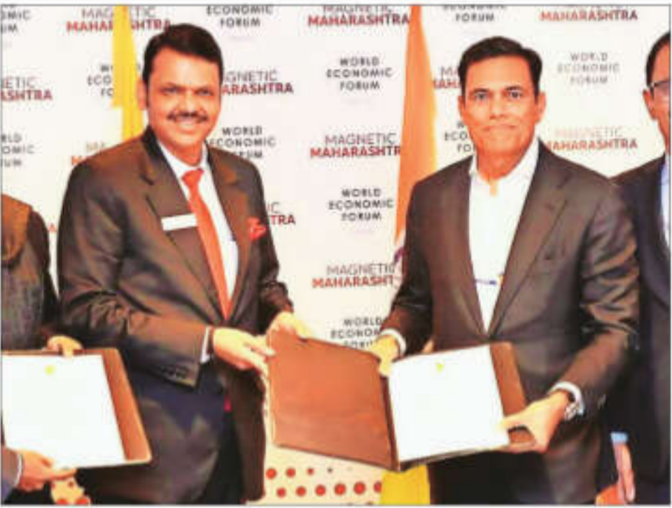
Maharashtra chief minister Devendra Fadnavis (left) and JSW Group chairman Sajjan Jindal signed an MoU at the 55th annual WEF meeting, in Davos on Tuesday

THE JSW GROUP on Tuesday signed a memorandum of understanding (MoU) with the Maharashtra government at the World Economic Forum (WEF) in Davos to invest ₹3 lakh crore across critical sectors in the state. The investment will focus on expansion and enhancement of steel manufacturing capacities with clean green technology, develop green energy projects, setting up advanced manufacturing units for new-age electric vehicles, developing facilities for high-performance EV batteries, strengthening the solar energy ecosystem.