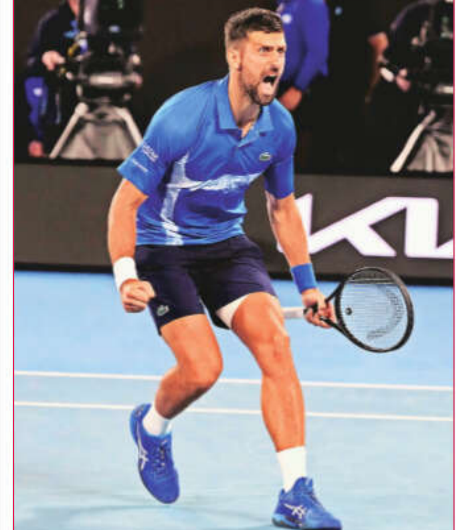
Novak Djokovic beat young rival Carlos Alcaraz 4-6 6-4 6-3 6-4 in a battle worthy of a title clash to charge into the Australian Open semi-finals on Tuesday and remain in the hunt for a record 25th Grand Slam title.