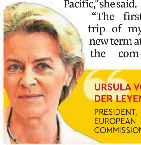
URSULA VON DER LEYEN , PRESIDENT, EUROPEAN COMMISSION The first trip of my new term at the commission will be to India

mission will be to India. Together with Prime Minister Narendra Modi, we want to upgrade the strategic partnership with the largest country and democracy in the world," she said. In July 2024, she was re-elected for a second term, which will continue till 2029. She further said, "I believe we also strive for mutual benefits with our conversations with China. All continents will have to deal with the growing burden of climate change and impact is impossible to ignore. "The Paris pact continues to be humanity's best hope and Europe will stay the course, she assured. Warning of the risk of a "global race to the bottom" using tools such as tariffs, she said the EU wants to engage and negotiate with US President Donald Trump. She said a more balanced relationship with China is needed. "Europe will keep seeking cooperation, with our long-time friends, and any country we share interests with," she added.