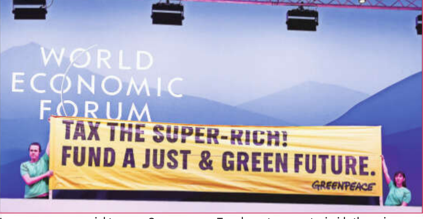
In a rare occurrence, rights group Greenpeace on Tuesday put up a poster inside the main venue of the World Economic Forum annual meeting in Davos. Protesters unfurled a large banner saying: 'Tax the super-rich. Fund a just & green future'