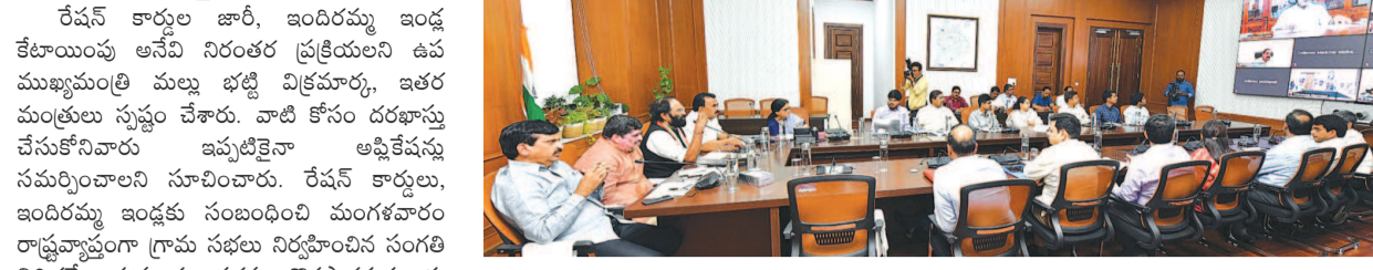
నవతెలంగాణ బ్యూరో - హైదరాబాద్

దరఖాస్తు చేసుకోనివారు ఇప్పటికైనా చేసుకోండి : పిడియో కాన్ఫరెన్సులో డిప్యూటీ సీఎం, మంత్రులు